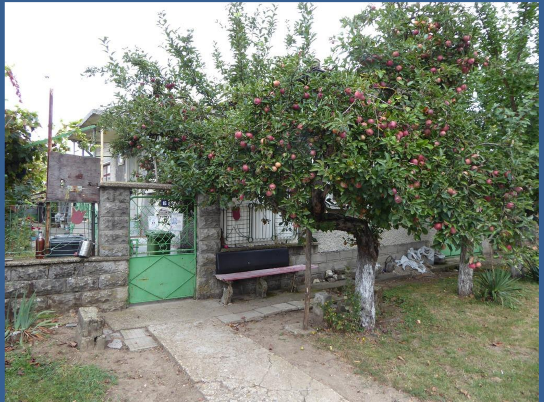
Oben: Unsere Unterkunft in Babovo