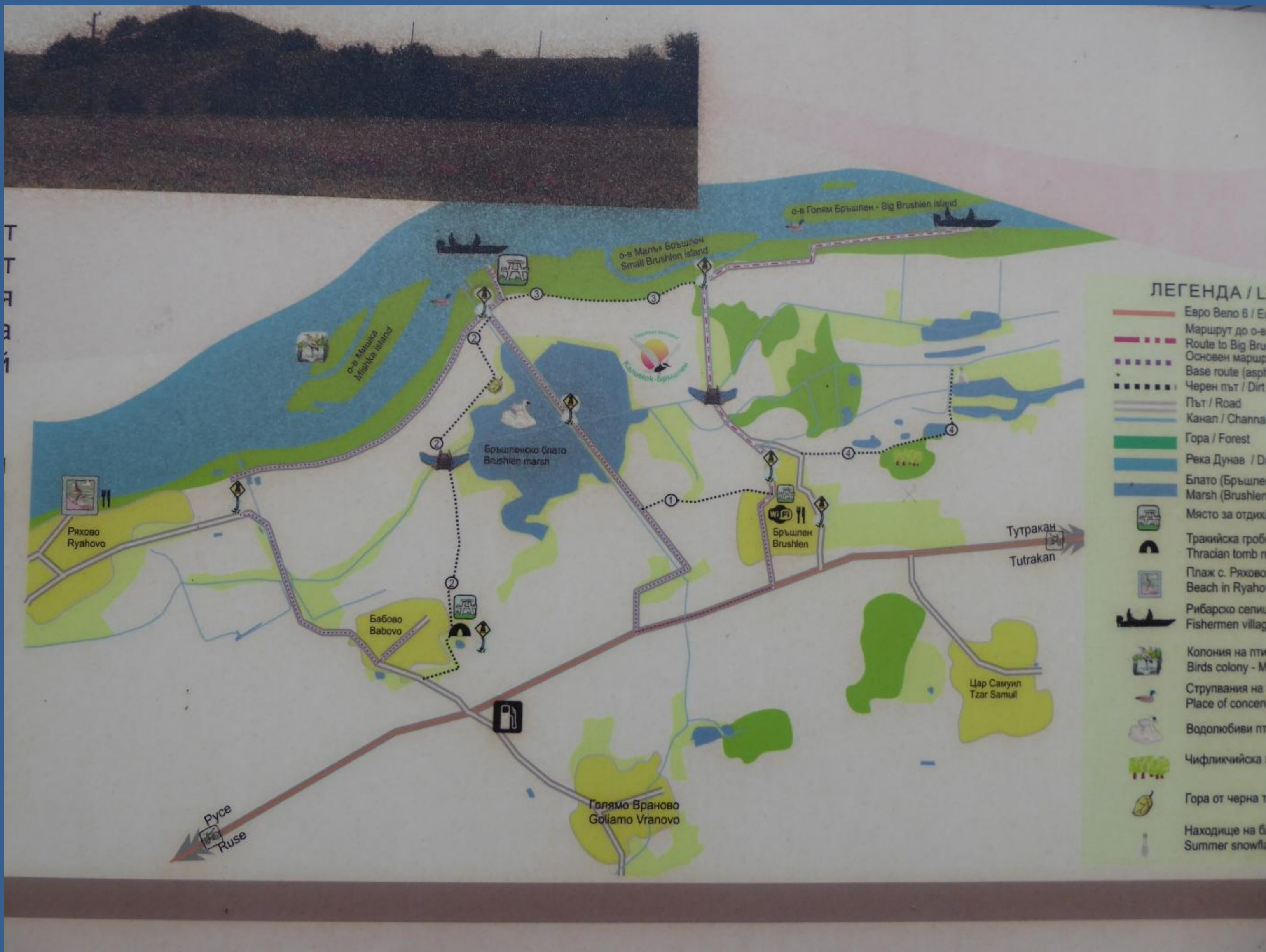
Die touristische Karte, den Weg 2 haben wir gefunden, die Wege 3 und 1 haben wir nicht gefunden, auch gibt es nicht den "Schwanensee".