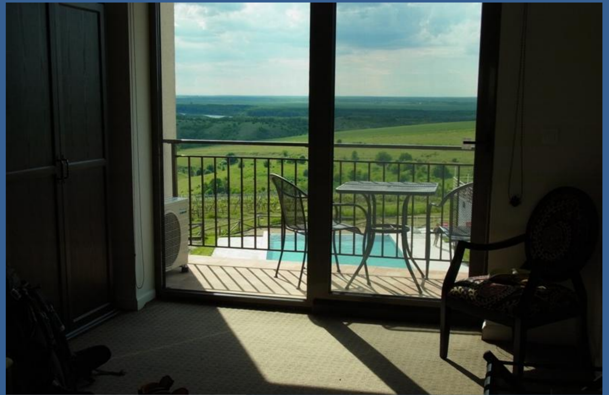
Das Hotel Seven Generations, mit Donau und Walachei-Blick und eigenem Wein