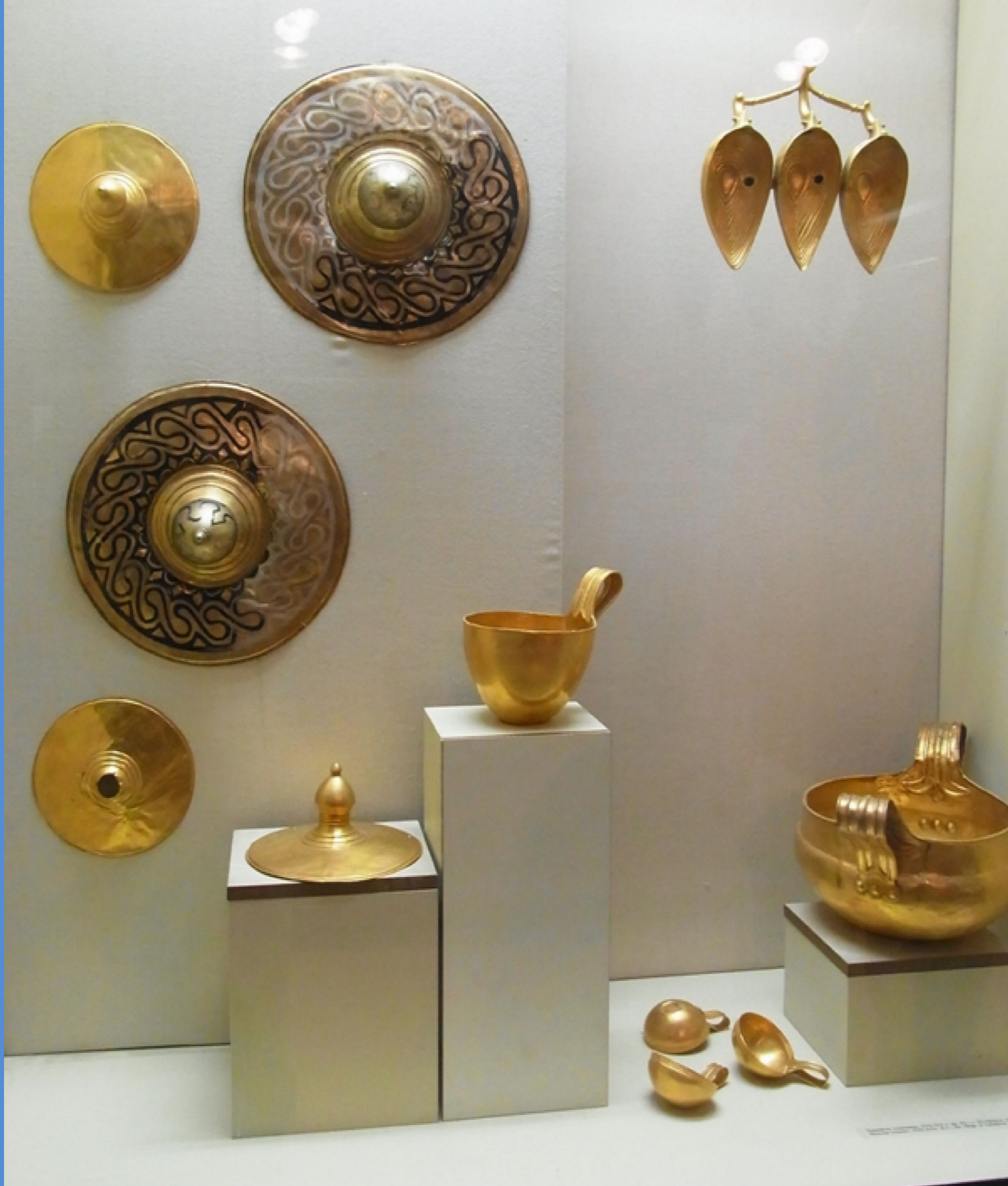
XVII-XVI в. пр. Хр., с. Вълчитрън, копие -XVIc. B.C., the village of Valchitran, copy

...колекцията му е шо украсена и със злато, и със сребро. дойде с оръжия златни, огромни, див- да ги видиш; не прилича на смъртни мъ- да ги носят, а на безсмъртните богове." Омир, Илиада