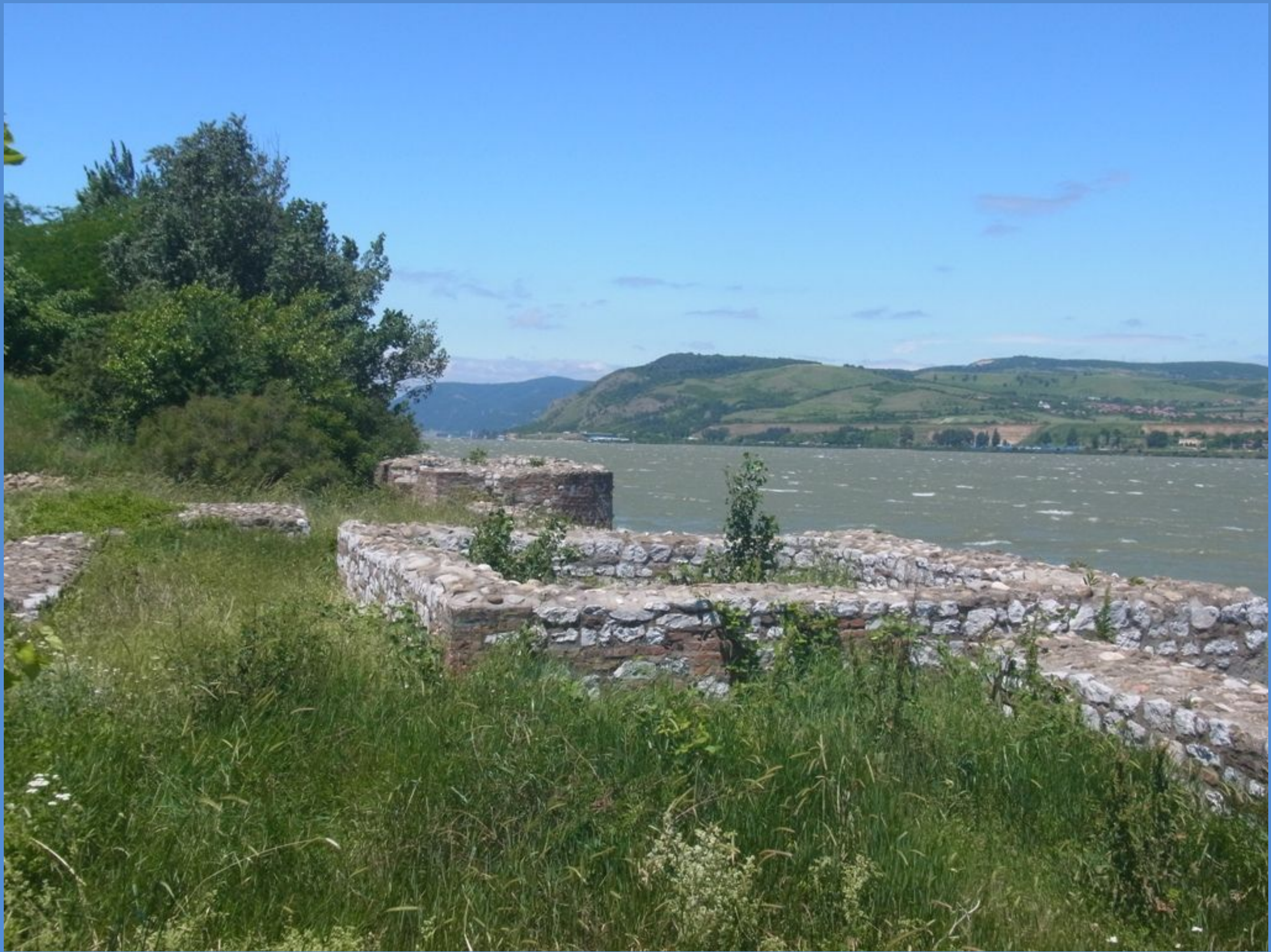
Festung Fetislam 16.Jh (1524)