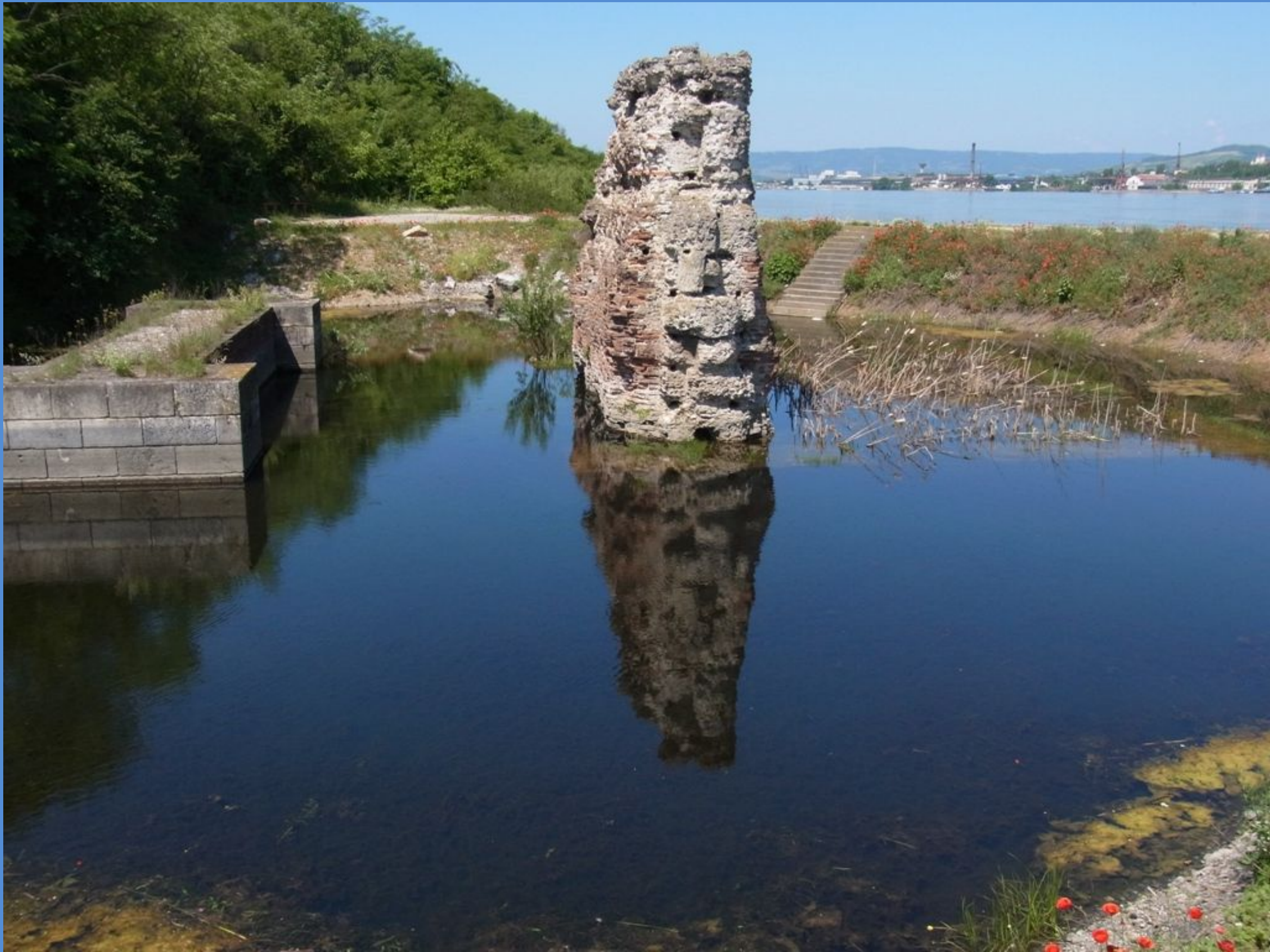
Pfeiler der Trajan Brücke 103-105