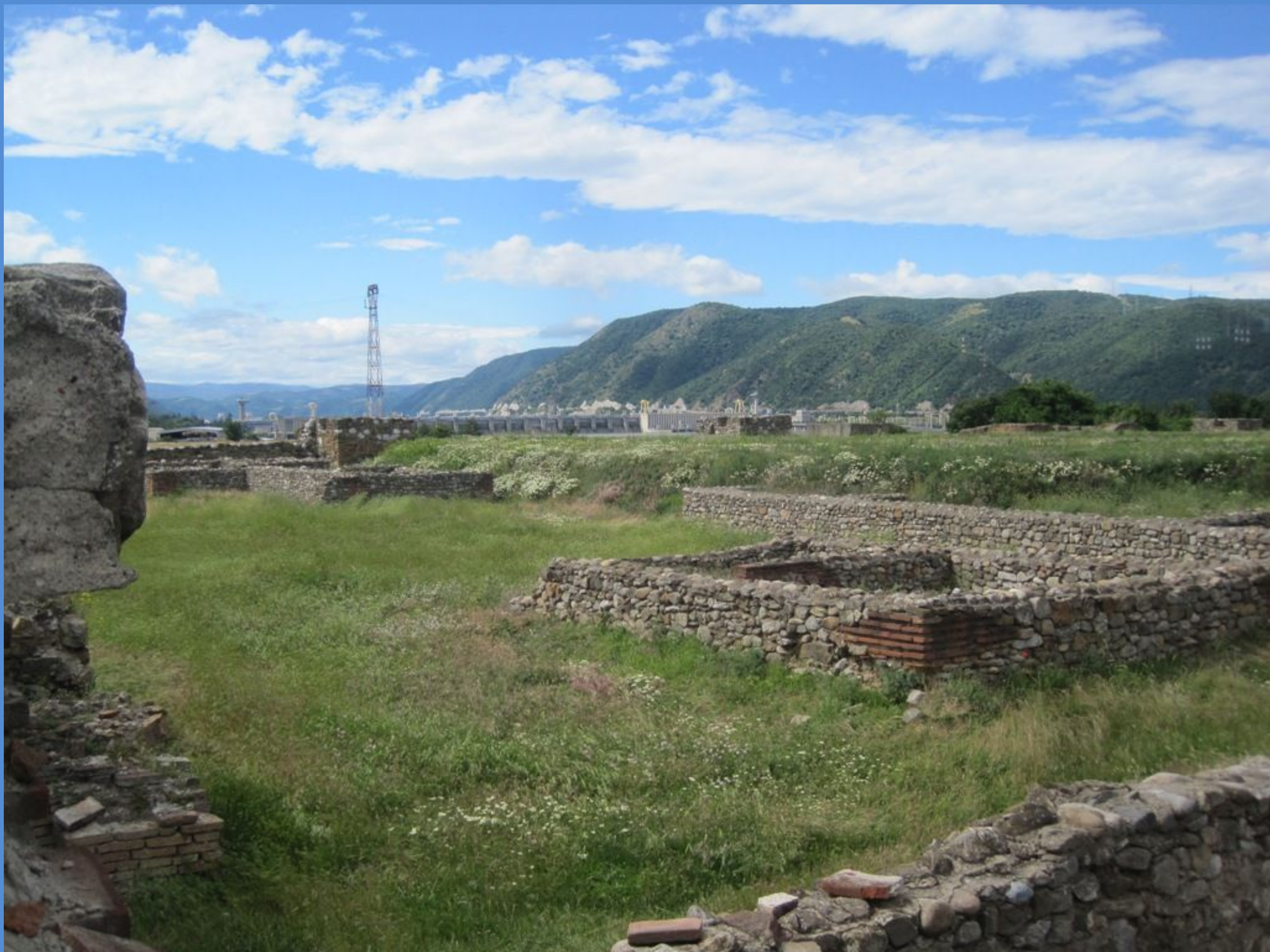
Djerdap 1 1968-1972, 2008 2192MW Festung Diana 1.-6.Jh