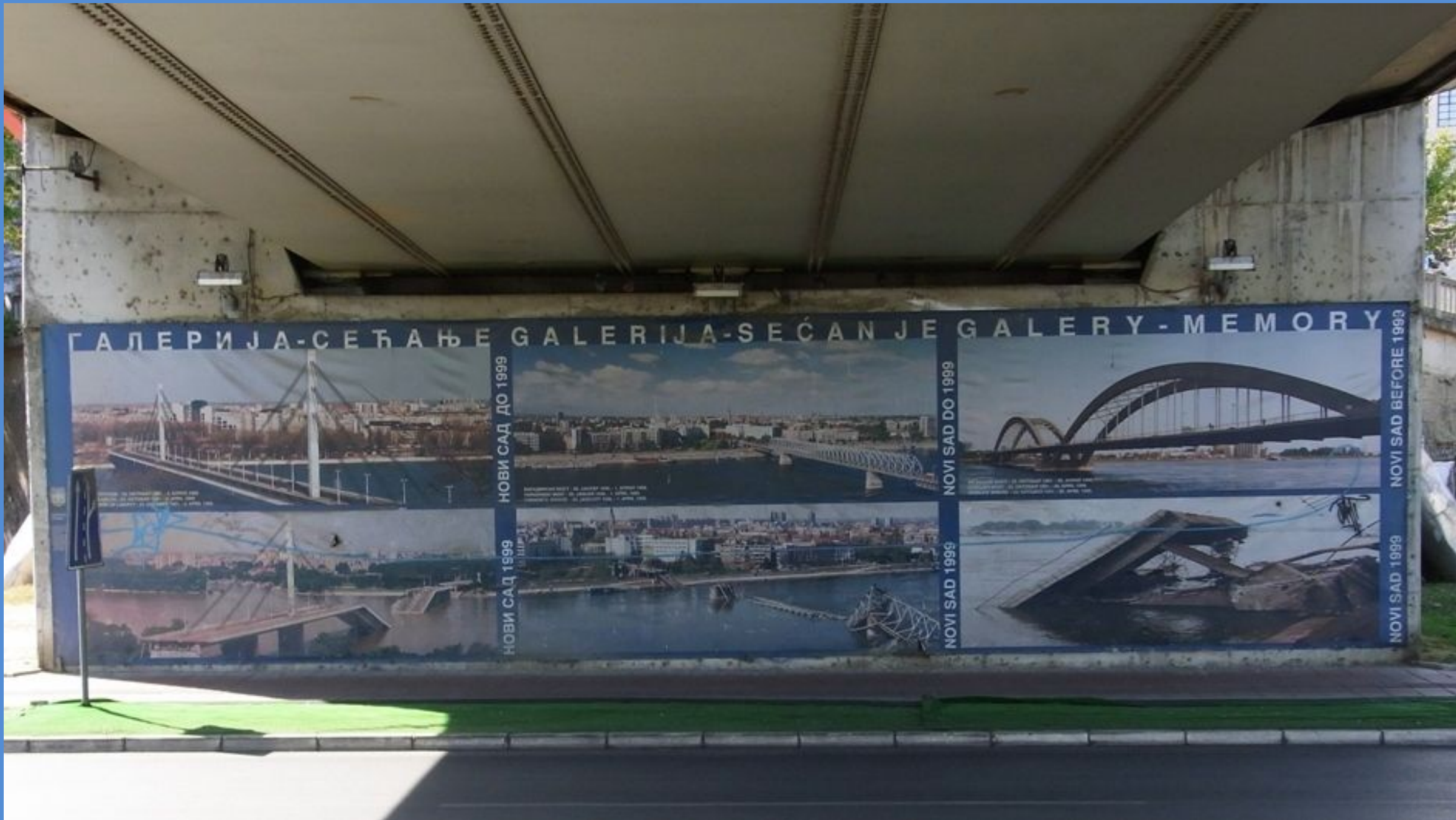
km 1256 Novi Sad 1999 von der Nato zerstörte Brücken