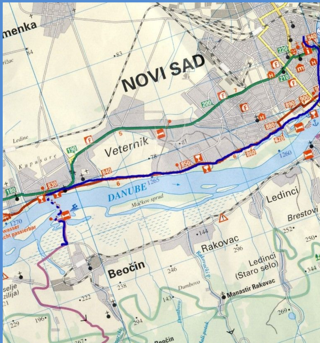
km 1267-1256 Beocin - Novi Sad