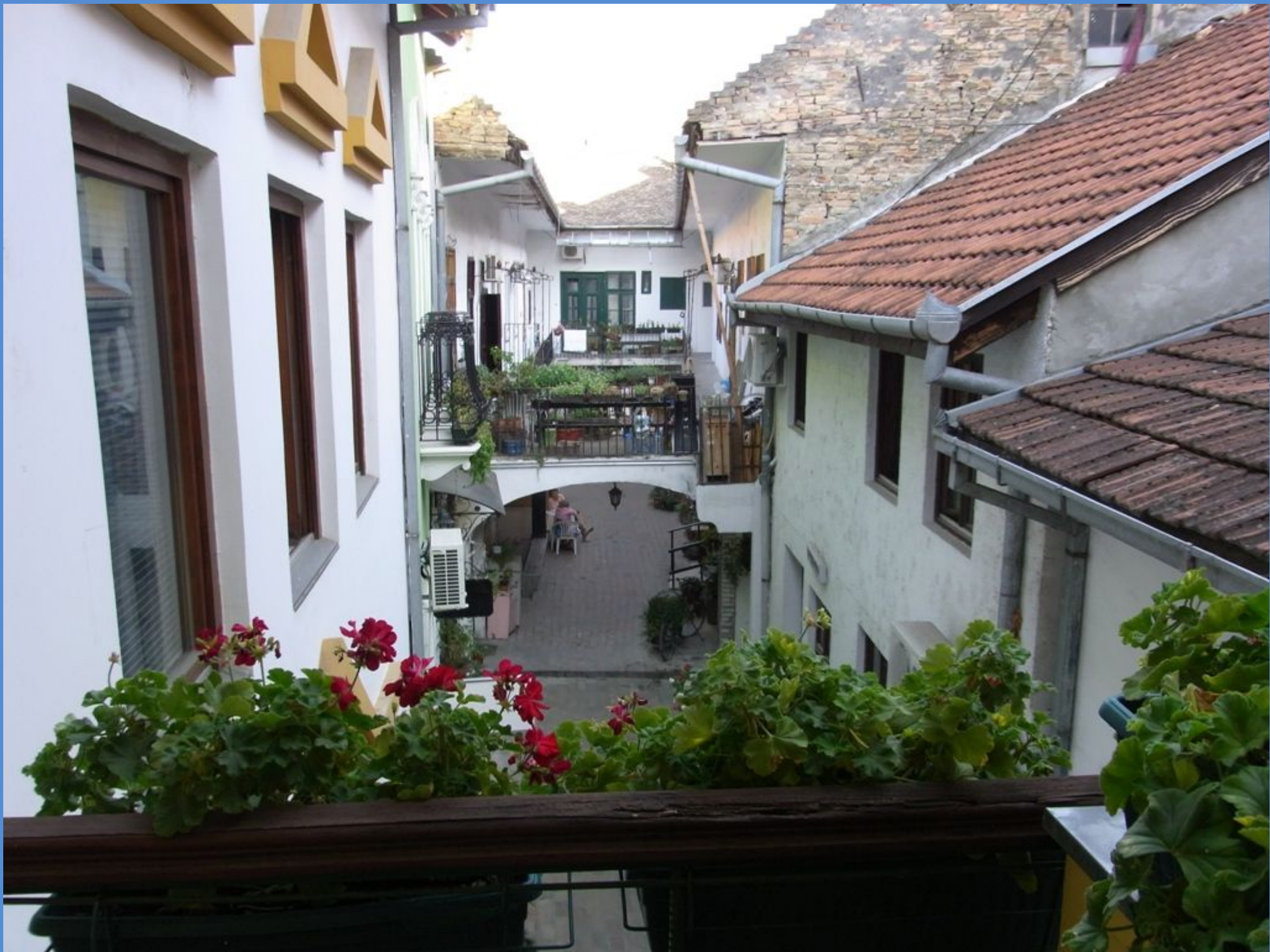
km 1256 Novi Sad Blick aus dem Hotelfenster, Hof direkt im Stadtzentrum