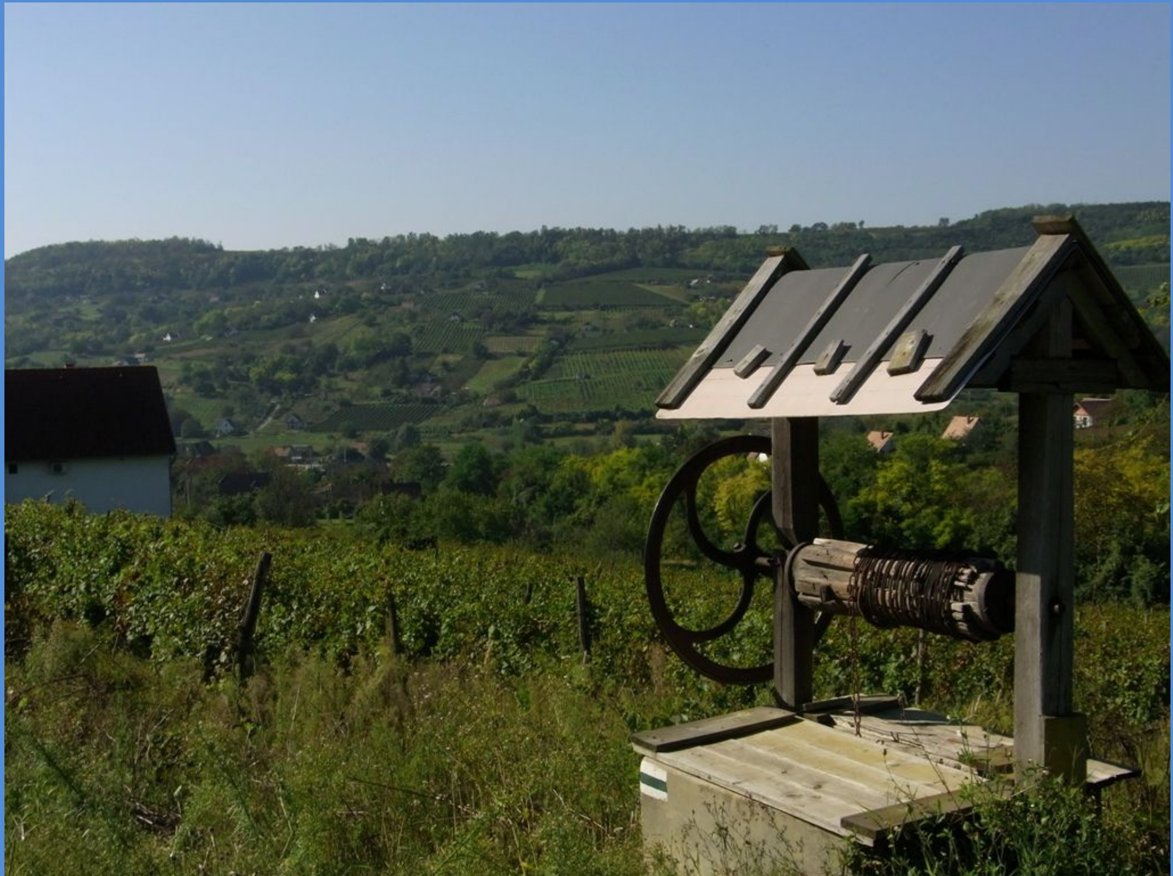
Szekszard, Stadt des Weins